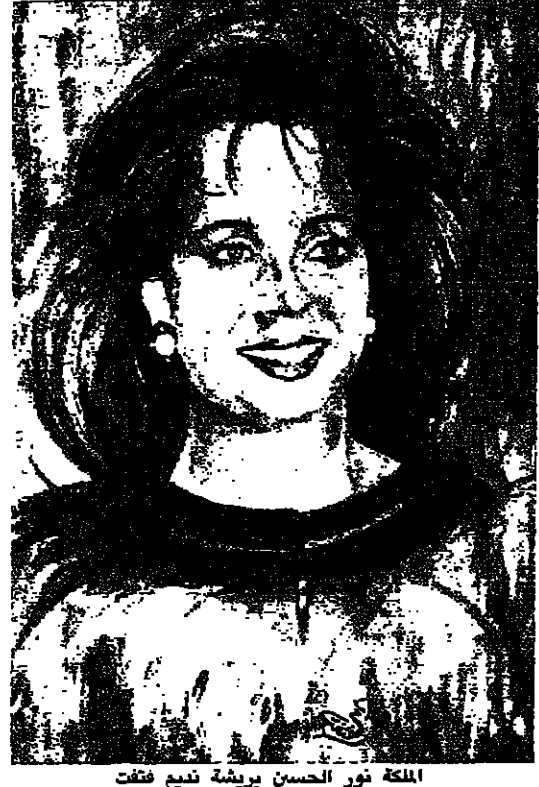
الملكة نور الحسين بريشة نديم قفط